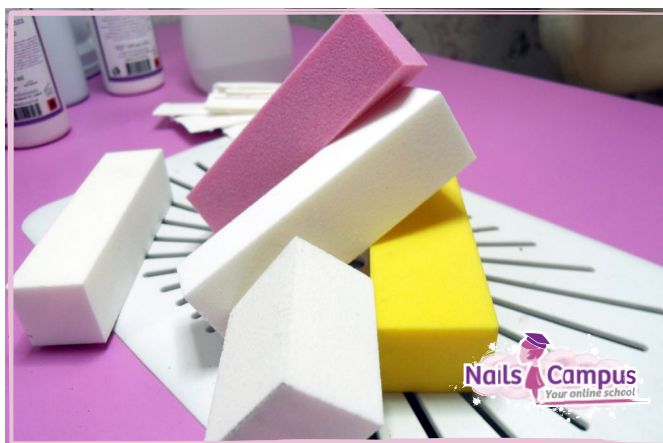
Diversi Colori e Modelli di Buffer (FOTO 18)