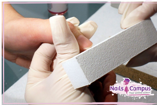
Con il Buffer eliminiamo le Tracce della Limatura (FOTO 17)