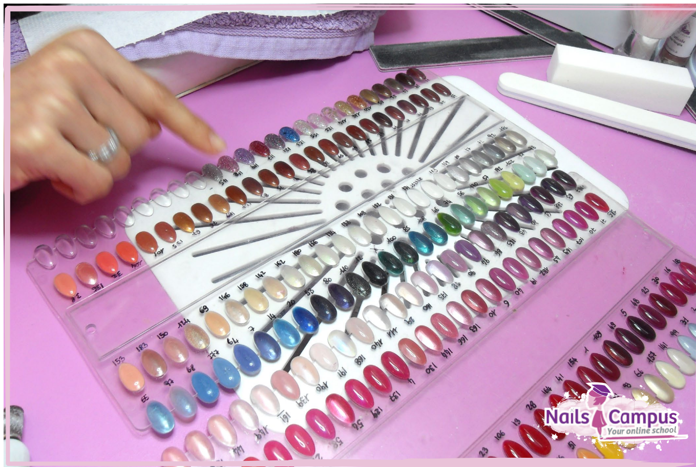
La Cliente Sceglie la Tonalità Desiderata (FOTO 24)

Lasciamo asciugare per qualche minuto il prodotto e scegliamo intanto il colore che desideriamo per le nostre unghie; in questo caso, la nostra cliente ha optato per un bellissimo Smalto per Unghie Lilla Chiaro Perlato! (FOTO 24 / 25)