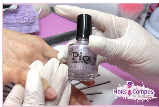
Smalto Lilla Perlato n°98 Pics Nails (FOTO 25)

Le nuance di colore a disposizione sono davvero tantissime!