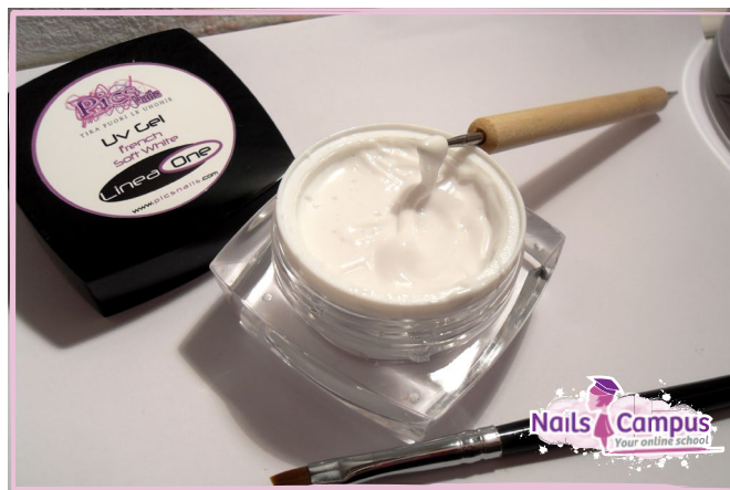
French Soft White Pics Nails (FOTO 20.2)