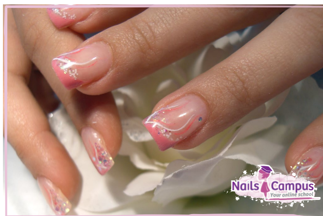
French Rosa (FOTO 37)

Divertiamoci ad impreziosire la nostra French!