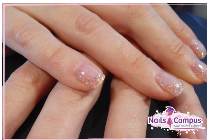
French laterale con Polveri Extra Glitter (FOTO 36)