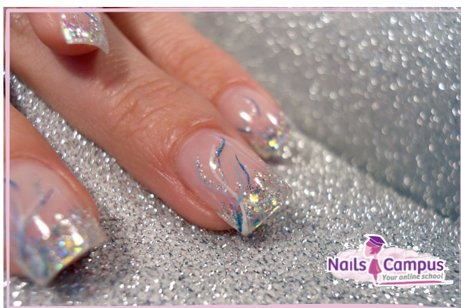
French con Polveri Glitter (FOTO 35)