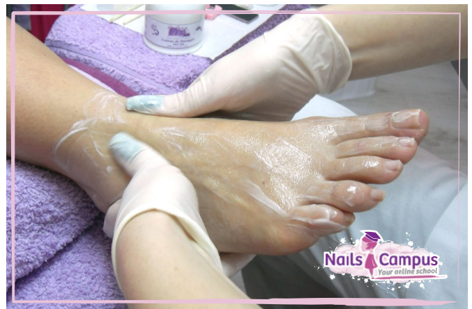
Massaggiamo con la Lozione da Massaggio Pics Nails (FOTO 39)

Con la Lozione e un buon massaggio già dopo qualche minuto avvertiremo una piacevole sensazione di benessere e sollievo per i nostri piedi!