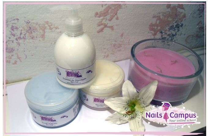
Lozione, Scrub e Maschera Pics Nails (FOTO 38)